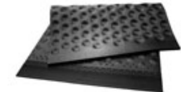
Variante: Unterlage UniCUP