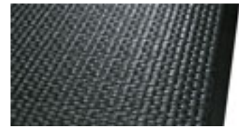
Fase am hinteren Rand