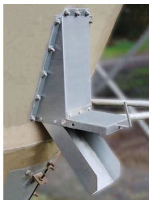
Handschieber für Silotrichter