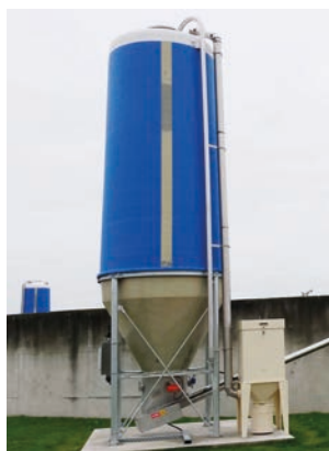
Sonderfarbe für Silo